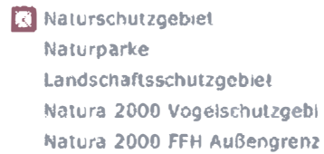
Abbildung 5: Lage der Windkraftanlagen und Naturschutz

Im Auftrag der Marktgemeinde Obersiebenbrunn