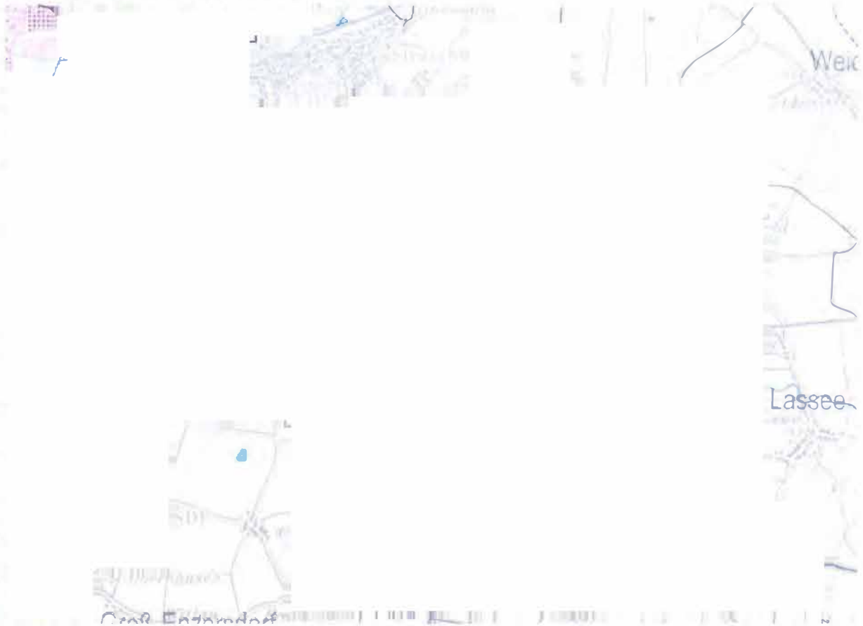
Abbildung 3: §19-Zonen (Ausschnitt)