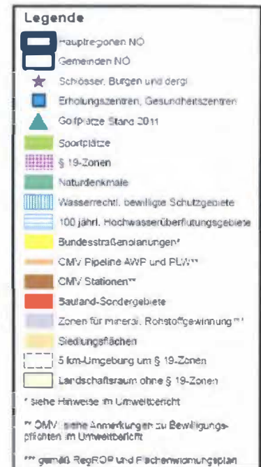
Abbildung 6: §19-Zonen und Bewertungsgrundlagen zum Umweltbericht des sektoralen ROP zur Nutzung der Windkraft (Ausschnitt)